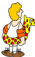
Un AN dans L'eau!