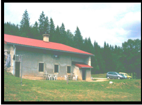
Vous verrez l'extension au prochain N° !!!

Des chiffres sur la fréquentation: 80% de remplissage en hiver et 30% en été !